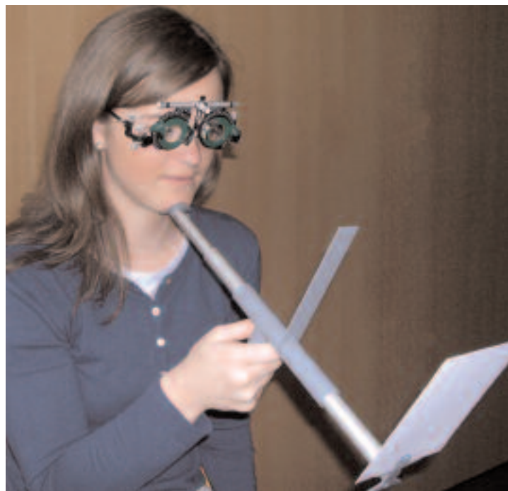
Figure 1. Avec le Proximètre®, la comparaison bi-oculaire est obtenue à l'aide d'un septum placé devant le texte.

Avec le Proximètre®, la comparaison bi-oculaire est obtenue à l'aide d'un septum placé devant le texte ( figure 1 ), selon le principe de la "balance de Turville" : l'œil gauche voit le début et l'œil droit la fin de la ligne de texte. On demande au sujet, muni de sa correction optique, s'il peut lire aussi nettement le début et la fin de la ligne. L'idéal est d'obtenir une égalité de netteté entre