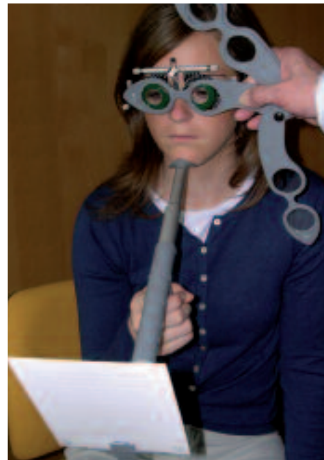
Figure 3. Mesure de l'amplitude d'accommodation avec le Proximètre®.

Par exemple, si un sujet ne peut plus lire avec un verre de -3,00 D, on essaye un verre de -2,50 D et s'il ne peut pas lire non plus, on retient la valeur de -2,00 D. L'amplitude d'accommodation est égale à : 3,00 - (-2,00) = 5,00 D.